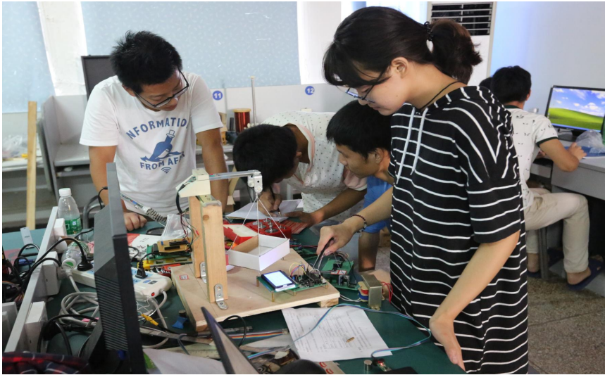
2016年7月“TI杯” 简易电子秤(一等奖)

日前，2016年“TI杯”湖北省大学生电子设计竞赛圆满结束，电子与信息工程学院参赛代表队在竞赛中再创佳绩。